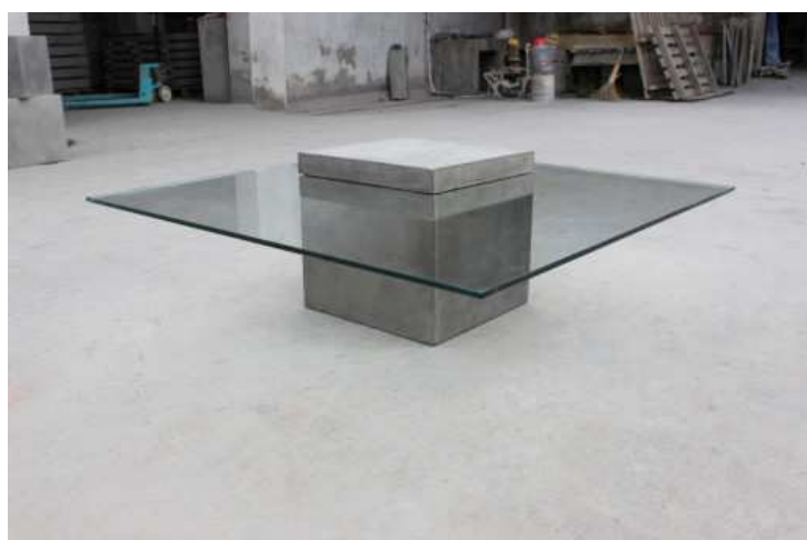
TABLE BASSE BETON CARREE AVEC PLATEAU EN VERRE