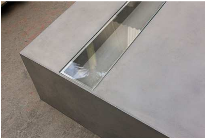
TABLE BASSE BETON JARDIN ZEN