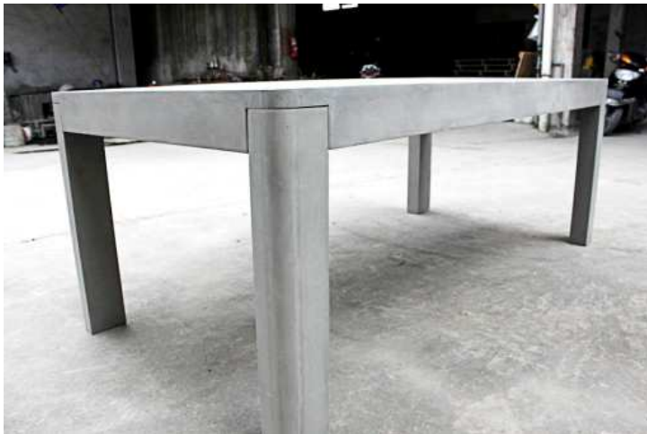
TABLE DE SEJOUR BETON TOUT EN COURBE