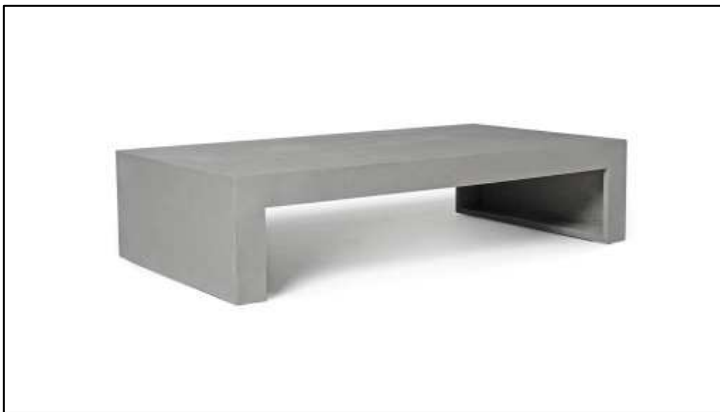
TABLE BASSE BETON H.30