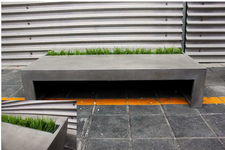
TABLE BASSE BETON DESIGN VEGETAL