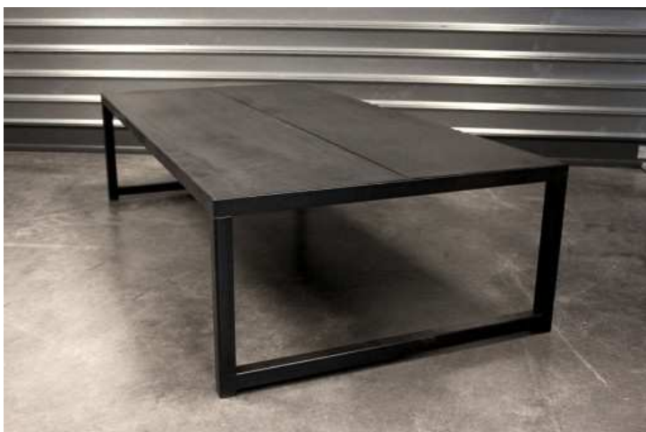
TABLE BASSE METAL ET BETON