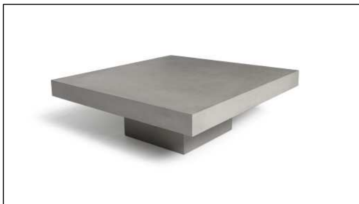
TABLE BASSE BETON CARREE