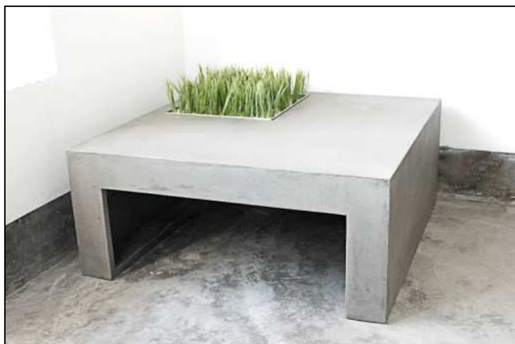
TABLE BASSE CARREE BETON DESIGN VEGETAL