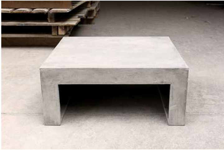
TABLE BASSE CARREE BETON