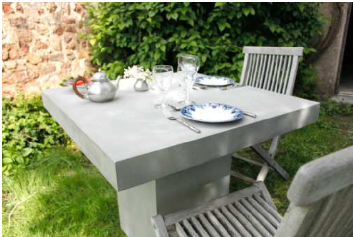
TABLE DE REPAS CARREE