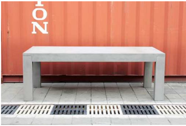
TABLE DE REPAS BETON