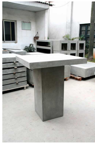
TABLE DE BAR BETON