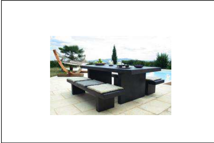
TABLE DE REPAS BETON