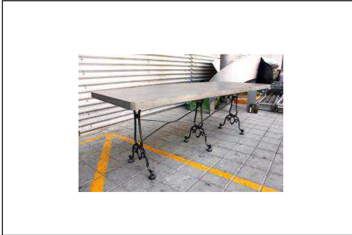
TABLE DE REPAS BETON PIEDS EN FONTE