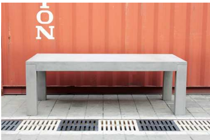
TABLE DE REPAS BETON