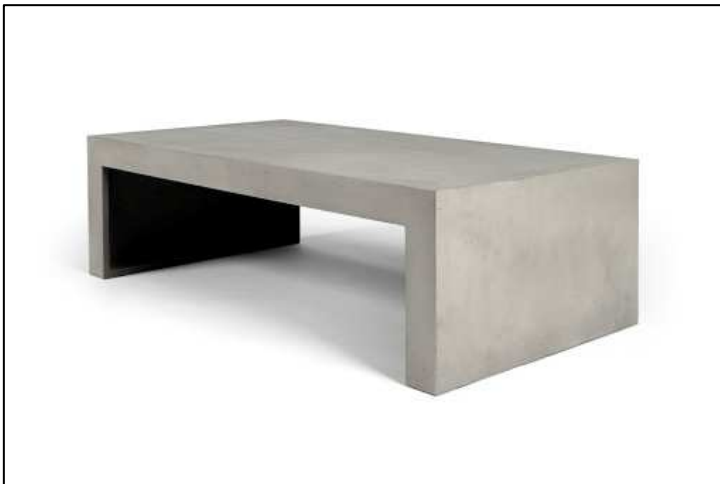
TABLE BASSE BETON H.40